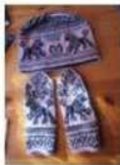
Strikkete votter og luer med hundemotiv