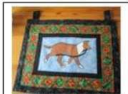
Malt hundebilde med lapperamme