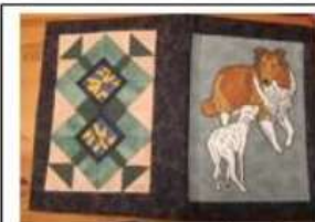
Skrytebok med malt hund og lappeteknikk