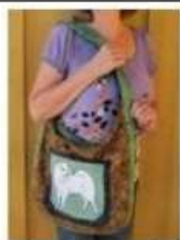
Veske med malt hund